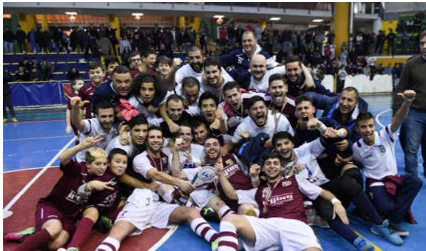
LAM Ferentino vincitore della passata edizione

RIETI OSPITA LA FINAL FOUR DI C1: L'ANIENE È LA FAVORITA, MA ATLETICO NEW TEAM, VIGOR PERCONTI E NORDOVEST DARANNO BATTAGLIA