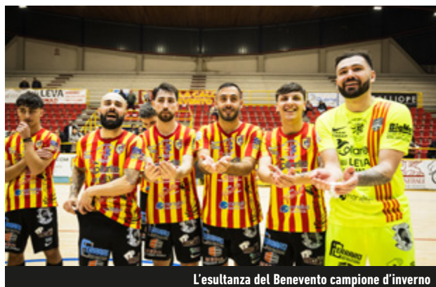
L'esultanza del Benevento campione d'inverno

il Milano, che difende il pass sul campo del Rovereto. MGM 2000-Cornedo è uno scontro diretto: chi vince può sperare. Stesso discorso per Belluno-Villorba: più difficile, ma entrambe in corsa. Testacoda anche nel gruppo B tra Ternana e Lucrezia. La Dozzese difende la seconda piazza col Prato, OR-Potenza Picena è decisiva. BFC a riposo e quindi già fuori. Il 3Z cerca riscatto contro il Russi. Eur-Hornets è il big match del Girone C: in palio anche il titolo di campione d'inverno. Il Pescara ospita la Cioli, la Tombesi fa visita al Celano. Il Taranto ospita la Gear Siaz per virare al primo posto nel Girone D, col Canicatti, in casa col Sannicella, a pressare. Mascalucia sul campo del Dream Team, il Bitonto in caccia del pass per la coppa nella sfida col Lamezia.