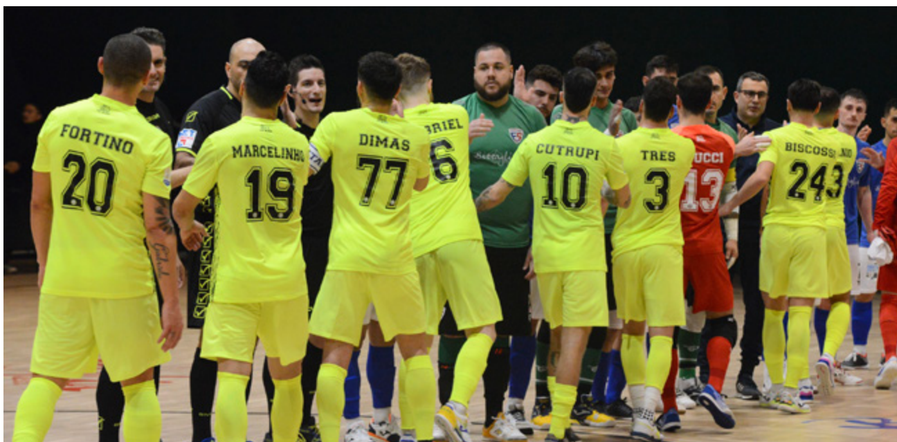
Il saluto nel match Fortitudo Pomezia-Olimpus Roma

Bagarre - La tredicesima giornata di regular season offre spunti interessanti vista la bagarre per entrare tra le prime otto: trappola derby per l'Ecocity Genzano contro un Ciampino che se la gioca sempre, insidia Active per un Napoli in ripresa che non vuole più fermarsi, trasferta da non sottovalutare per i campioni d'Italia: il Saviatesta Mantova di Jesulito può mettere in difficoltà chiunque. Punti pesantissimi in palio a San Rufo: lo Sporting Sala Consilina, senza più Bateria ma con un Thorp in più nel motore, riceve una Fortitudo Pomezia tornata al successo prima della sosta e che non ha più voglia di fermarsi.