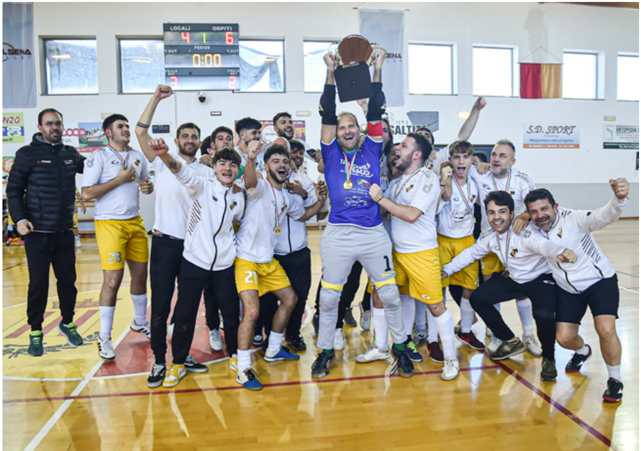
Il Cures vittorioso nella passata edizione