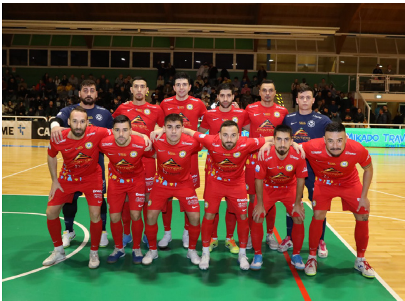
La formazione azzurra vittoriosa a Treviso