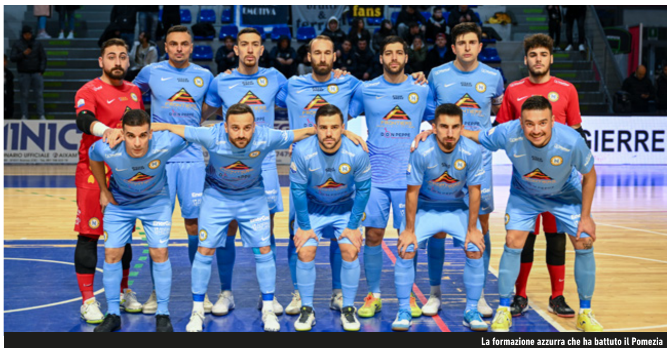
La formazione azzurra che ha battuto il Pomezia