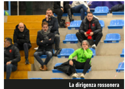
La dirigenza rossonera