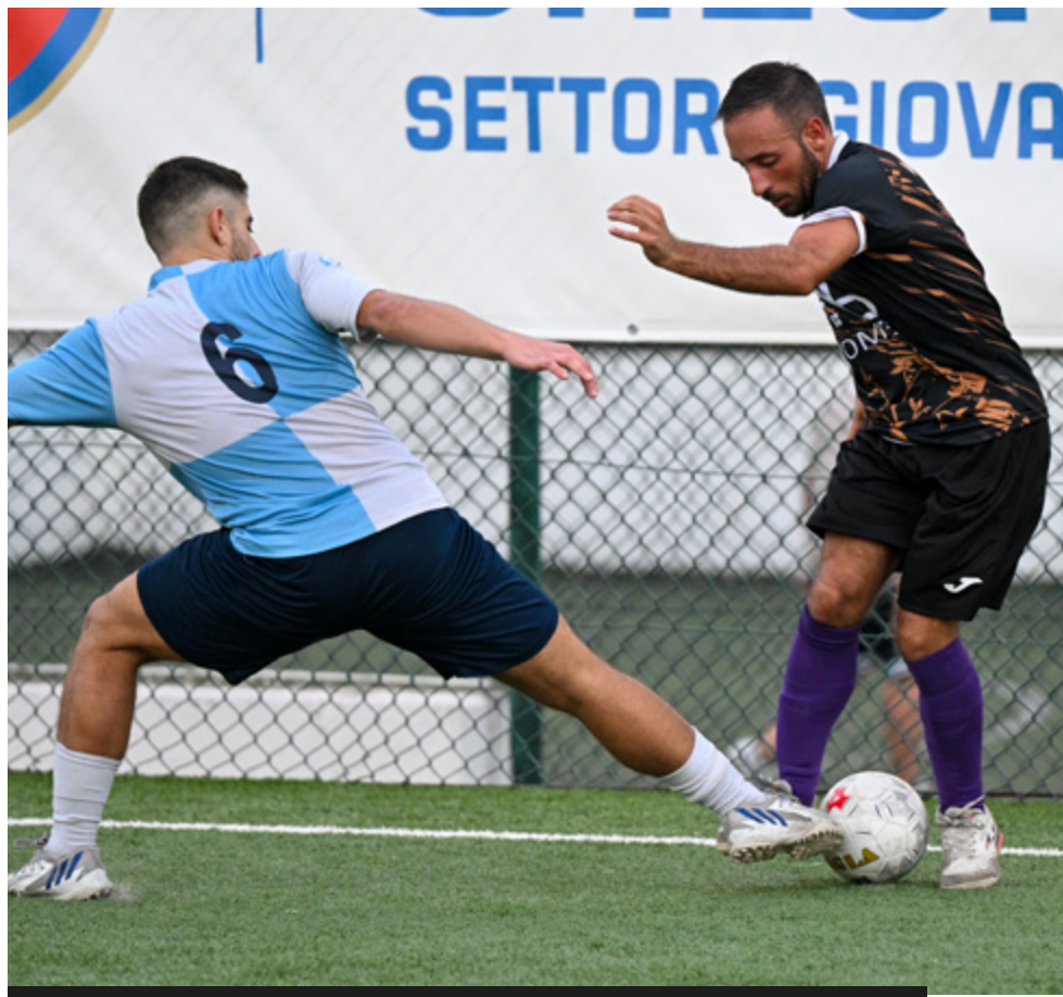
Una fase di gioco di Ulivi Village-Città Eterna

Lo scontro diretto fra Sora e Lido il Pirata, poi, metterà in gioco punti pesanti per il postseason. Anche l'Accademia Sport cercherà di aggiudicarsi il duello con il Flora per non rischiare di perdere terreno sulle altre contendenti ai playoff. Littoriana-Ceprano e NF Ardea-Monte San Biagio, infine, sono i match riguardanti le compagini impegnate nella bagarre per la salvezza.