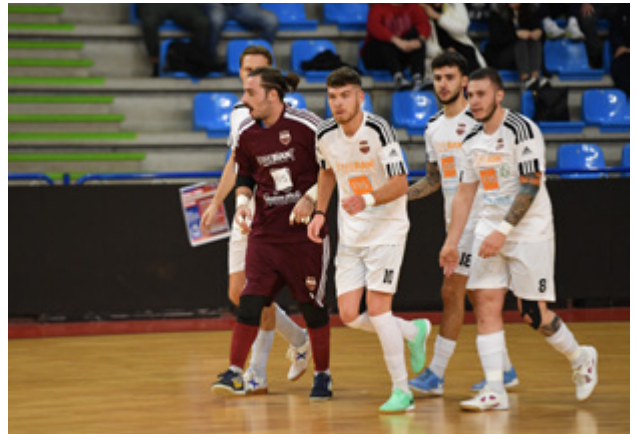
L'esultanza dello Zagarolo vittorioso sulla capolista Heracles