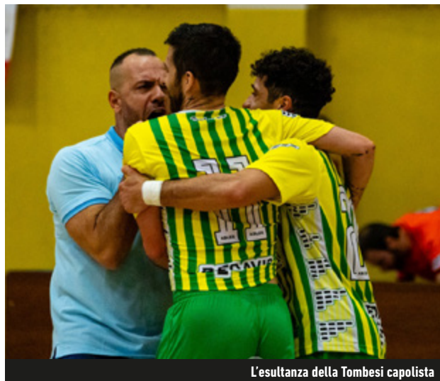
L'esultanza della Tombesi capolista

BFC bene sul Lucrezia: i rossoblù agguantano l'OR fermo ai box. Alla Tombesi Ortona lo scontro diretto tra prime della classe con lo Sporting Hornets. Romani raggiunti dal Pescara, di misura sull'Anzio in casa. A -3 dal podio del Girone C l'Eur, che batte e stacca l'Italpol. La Cioli non va oltre il pari col Frosinone e fallisce l'aggancio alla zona playoff. Cambio della guardia nel gruppo D: il Canicatti approfitta della frenata del Taranto e, battendo il Lamezia, si prende la vetta. Il Mascalucia vince a domicilio sul Monopoli e consolida il piazzamento sul podio.