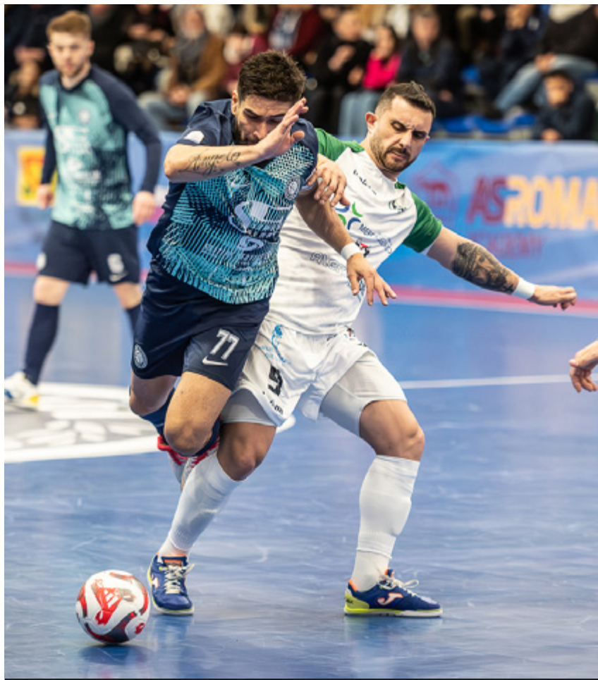
Una fase di gioco di Olimpus Roma-Sandro Abate

bagarre-playout, con sei squadre racchiuse in otto punti. Mantova e Olimpia Verona sembrano andate. Almeno fino a prova contraria.