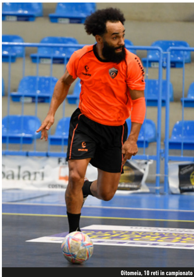
Oitomeia, 10 reti in campionato

Quando si perde, c'è sempre qualcosa da imparare. Oitomeia lo sa e indica la strada per il