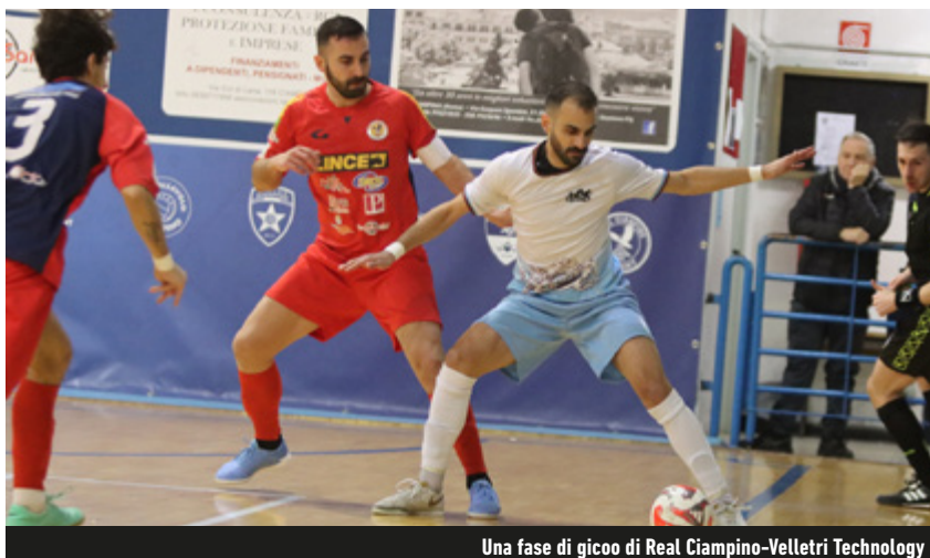
Una fase di gioco di Real Ciampino-Velletri Technology

Girone A-D - Girone A apertissimo con quattro squadre in un punto. Il Nizza non sa più vincere: stop col VDL, che lo raggiunge a 22, e crolla al terzo posto. In testa, a +1, Bresso ed Energy Saving. Compagnia Malo e Bissuola non si fanno male nel big match del gruppo B: i primi restano a +2 dai secondi. Riducono il divario (-5) i due Giorgione: il Futsal stende il Miti Vicinalis; il Team ne fa 5 al Naonis. Tutto uguale nel Girone C: un punto per la capolista Pontedera e per la seconda forza, il Prato, contro il Boca Livorno quarto e la Mattagnanese, sul gradino più basso del podio. Rosicchia punti a tutti il Bagnolo, in doppia cifra sulla Sangiovese. Il Grifoni ne rifila ben 11 al Gadtch e mantiene il doppio