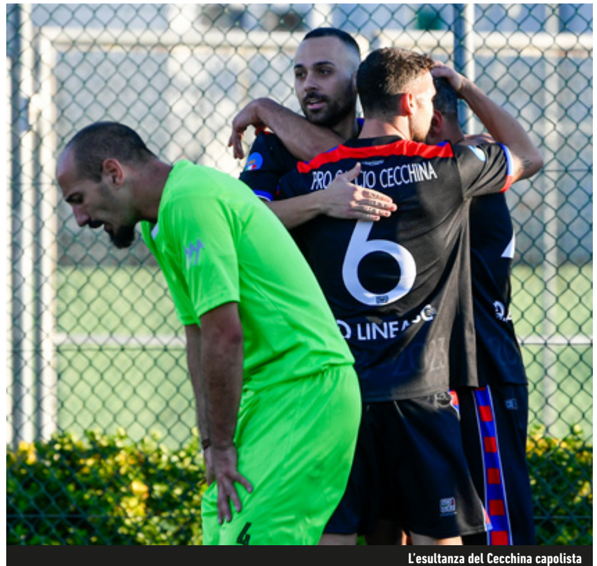
L'esultanza del Cecchina capolista

Terracina ha avuto ragione per 6-2 del Cislè, mentre i "cugini" dello Sporting hanno steso 2-0 l'Insieme Formia a domicilio. Il centro di Polzella ha deciso la gara tra il Flora e l'Accademia Sport in favore dei padroni di casa. Il Ceprano e il Monte San Biagio, entrambi lontani dalle mura amiche, hanno rispettivamente regolato la Littoriana (2-7) e l'NF Ardea (0-14). Flora e Cislè, in programma sabato 27 gennaio, duelleranno in uno scontro diretto per la permanenza nel regionale.