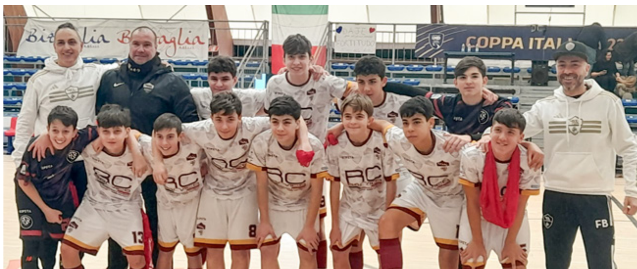
La formazione Under 15 Élite