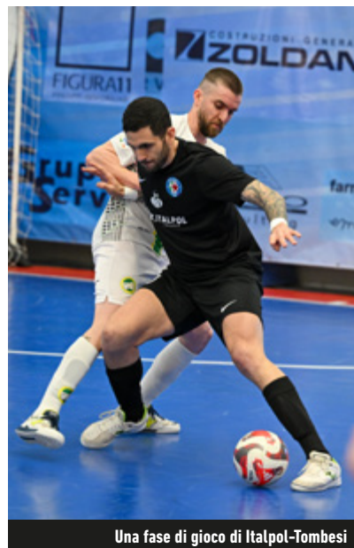
Una fase di gioco di Italpol-Tombesi

Bitonto: il Taranto si prende un punto a Lamezia e affianca i siculi al primo posto del Girone D. In agguato il Mascalucia: dopo il 6-2 al Palermo, è a tre lunghezze dalla coppia di testa.