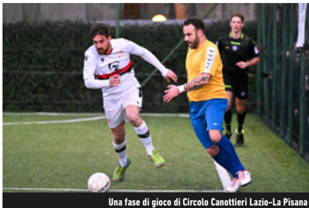
Una fase di gioco di Circolo Canottieri Lazio-La Pisana

alla Sanvitese di scavalcare gli stessi citizens sul gradino più basso del podio. Il Parioli, sconfitto 5-1 in casa del Gaeta, è rimasto ai margini della zona playoff, mentre l'Ardea - vittorioso con lo stesso punteggio - può ora guardare con maggiore fiducia alla salvezza diretta. Anche il Latina, che ha superato 3-2 l'Albano, e il Ciampino, reduce dal successo per 6-2 sul Casalbertone, hanno effettuato tre importanti passi verso la permanenza in C1. Il roster di Baldelli, nel prossimo weekend, cercherà la prima gioia del nuovo anno contro la Laundromat.