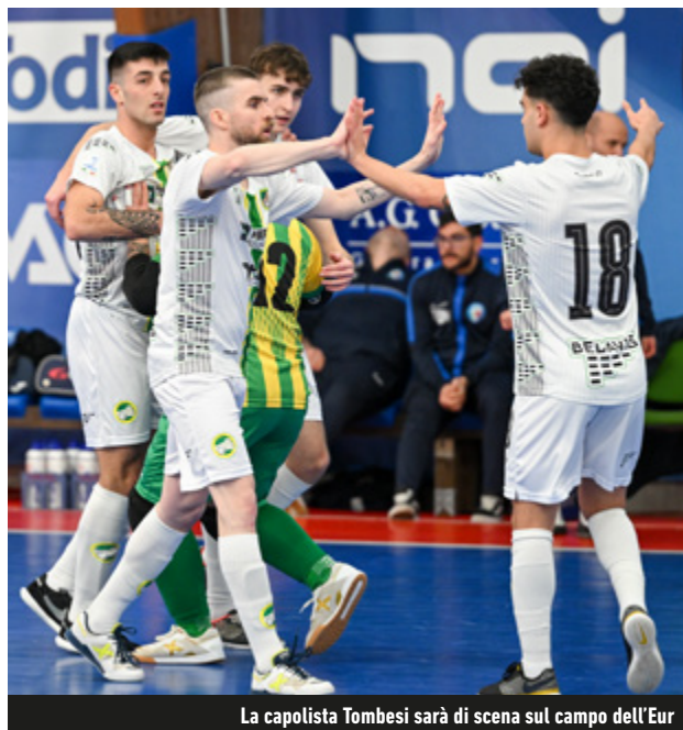
La capolista Tombesi sarà di scena sul campo dell'Eur

per il Girone C: Tombesi sul campo dell'Eur, il Pescara va in casa dell'Italpol. Può approfittarne l'Hornets, che sfida il Frosinone. Dem-Castel Fontana può riaccendere la corsa alla salvezza. Canicattì-New Taranto è la supersfida del Girone D, col Mascalucia che guarda interessato da Piazza Armerina.