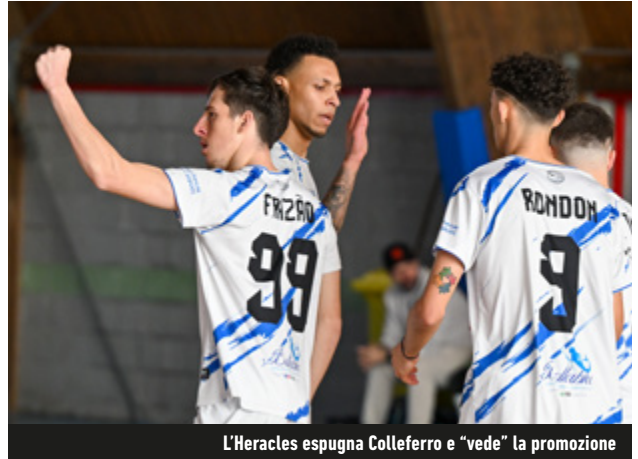
L'Heracles espugna Colleferro e "vede" la promozione

Buenaonda è stata capace di realizzare ben undici reti, spazzando via il Casalbertone (11-3). L'Ardea, a segno 2-1 sul Parioli, ha staccato la Levante Roma, rimasta bloccata al decimo posto a causa della sconfitta esterna patita col Ciampino (4-2). Il Gaeta, infine, ha superato 3-2 l'Albano. Il match fra i citizens amaranto e quelli rossoneri è la sfida di cartello della diciannovesima giornata.