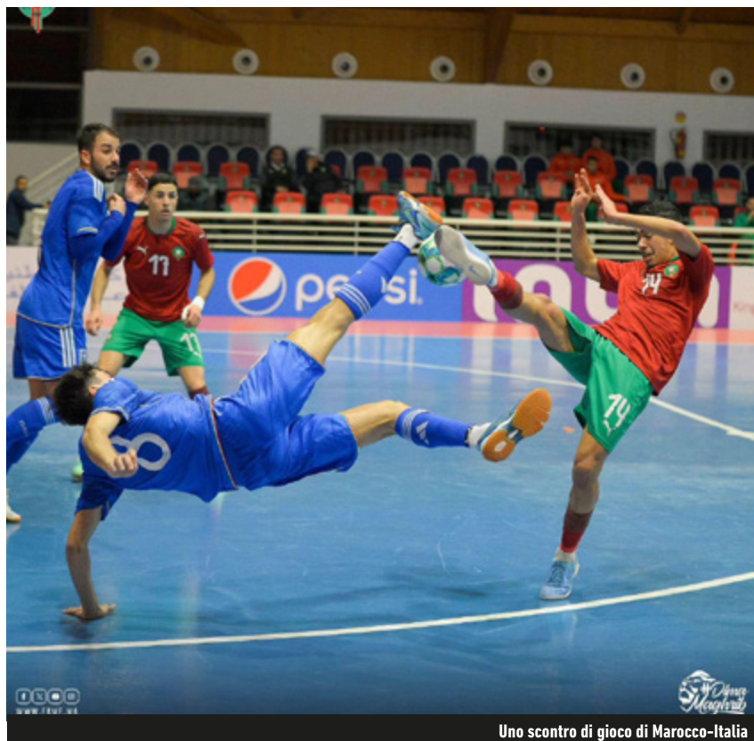
Uno scontro di gioco di Marocco-Italia