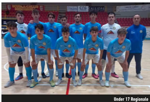
Under 17 Regionale

vivaio per raggiungere prestigiosi traguardi a livello nazionale e ad aumentare l'interesse e la partecipazione dei ragazzi nel tessuto sociale del territorio". Lo sport, in determinati contesti, può essere uno strumento fondamentale. Il Napoli lo sa bene.