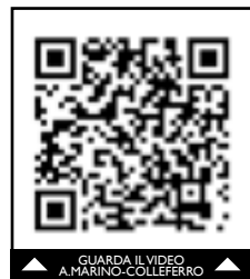
GUARDA IL VIDEO A MARINO COLLEFERRO

ragazzi, migliorare e cambiare rotta per avere una qualità in più soprattutto a livello disciplinare e di comportamenti rispetto al passato". Nel prossimo turno l'Atletico ospiterà la capolista Anni Nuovi Ciampino. Ci sarà da vendicare il pesante 10-1 subito all'andata: "Quella è stata una partita un po' strana - ricorda Morgillo -. Si trattava della seconda partita della stagione e avevamo pareggiato la settimana prima una partita incredibile all'ultimo secondo contro il Subiaco. Eravamo una squadra nuova, poi ci siamo presentati in campo rimaneggiati e costretti ad aggregare dei ragazzi degli allievi con noi. Non avevamo a disposizione sei giocatori per via di squalifiche della stagione passata o di problemi con il tesseramento. Sul 3-1 chiaramente la partita era già terminata e dopo diventa normale prendere un'imbarcata quando ti manca la forza per reagire. Adesso è tutta un'altra situazione, siamo una squadra diversa e cercheremo di contrastare la capolista e arginarla". Allievi – La formazione Allievi esce sconfitta in casa per 4-6 nella gara con la Virtus Romanina. Nel prossimo impegno si andrà a far visita al San Giustino, una rivale per la lotta ai play-off.