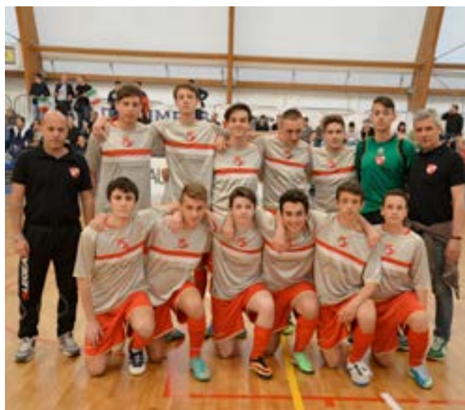
La squadra che lo scorso anno ha disputato la finale Allievi.JPG