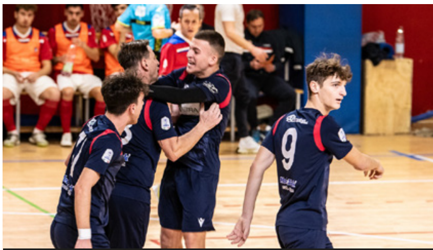
L'esultanza dello United Pomezia

Gironi A-D - La Domus Bresso impone il pari all'Energy Saving e lo costringe a cedere lo scettro del Girone A, passato ora - di nuovo - tra le mani del VDL Fiano Plus. I piemontesi, grazie al poker esterno inflitto al Rho, si sono portati a +1 sui lombardi. Si chiude in parità lo scontro diretto in vetta al gruppo B tra Futsal Giorgione e Compagnia Malo: quest'ultimi restano davanti con 5 lunghezze di vantaggio. Il Bissuola cade col Naonis - ultimo - e viene raggiunto dall'Atesina al terzo posto. Nel Girone C, il tris al Sant'Agata consente al Pontedera di riportarsi a +6 sul Prato, caduto sul campo del