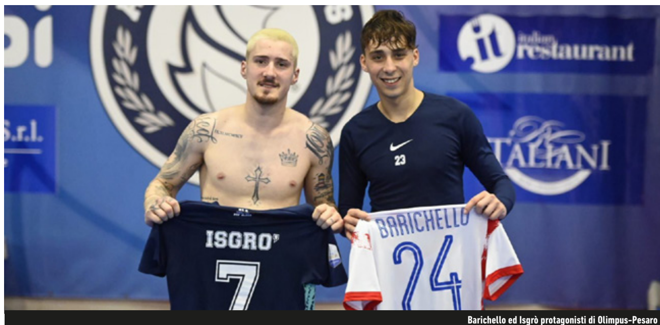
Barichello ed Isgrò protagonisti di Olimpus-Pesaro

Flop Meta - Anche Napoli Futsal e L84, pur regolando chi 3-1 l'Active e chi 2-0 il Meta Catania, hanno dovuto risolvere tante complessità proprie non solo di sfide secche, ma anche delle rispettive avversarie. Chi esce sconfitto da questo primo switch è il Meta Catania, partito per sua stessa ammissione per alzare un trofeo: non sarà la Coppa Italia, non gli resta che lo scudetto, ossia l'impresa più difficile. Come per lei, così per le altre che puntano a sventolare il tricolore.