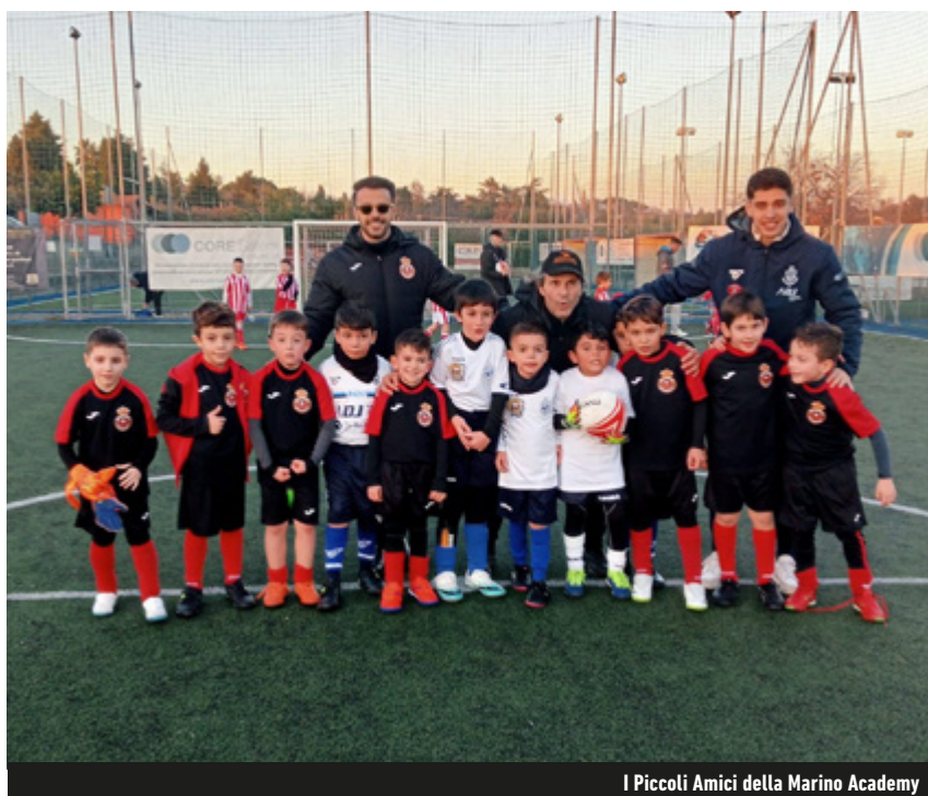
I Piccoli Amici della Marino Academy

Il lavoro - Allenare i Piccoli Amici richiede un duplice impegno: "Sono bambini di 6-7 anni, oltre alla