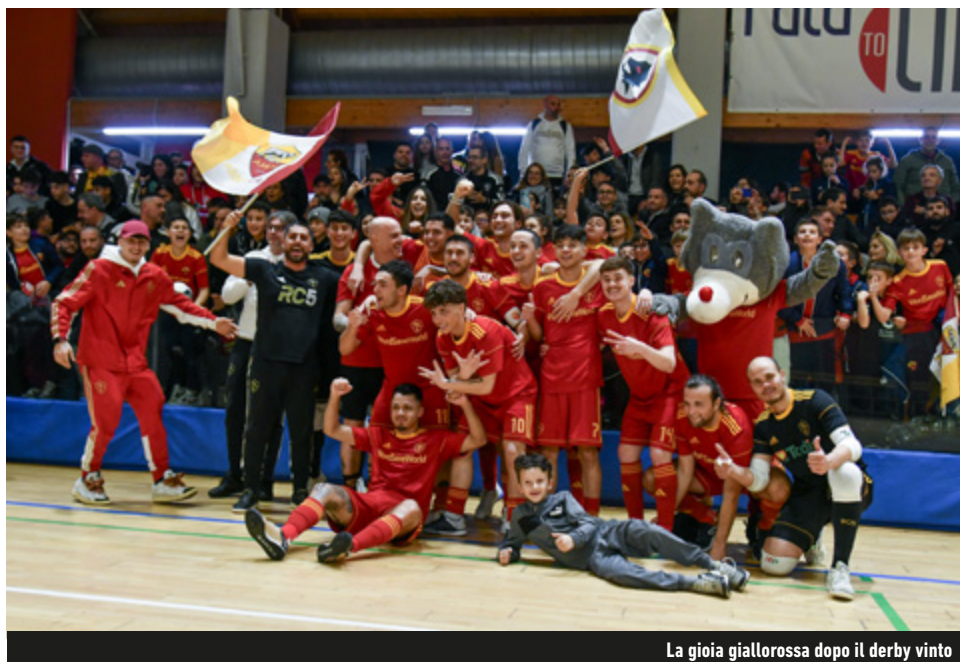
La gioia giallorossa dopo il derby vinto

Ero del match - "È stata una partita davvero complicata. Nonostante le partenze, la Lazio ha dimostrato di essere una formazione forte e organizzata, ma noi