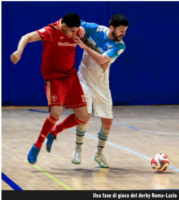
Una fase di gioco del derby Roma-Lazio

a riposo, e sull'Eur, largo sul campo del Castel Fontana. Taranto e Canicatti a braccetto nel Girone D: la prima a segno col Palermo; la seconda ne fa 6 al Molfetta. Scivola a -5 il Mascalucia.