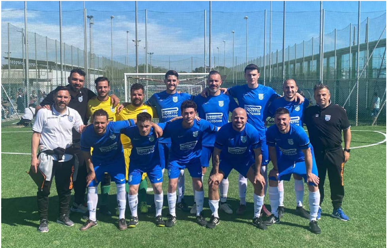
La formazione della Conauto Lidense

disputare il match del turno inaugurale in trasferta: "Ci attenderà una partita sicuramente molto dura e maschia - conclude Fusco -. Al termine di questa durissima sfida vedremo quale sarà il verdetto del campo e quale tra le due squadre sarà stata la più forte".