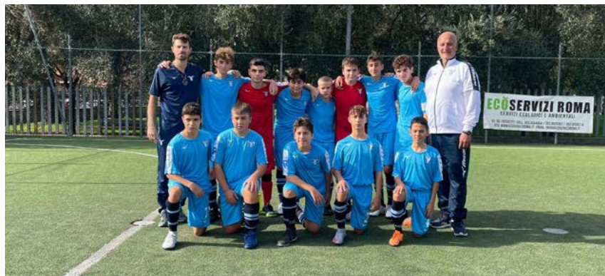
L'Under 15 Regionale