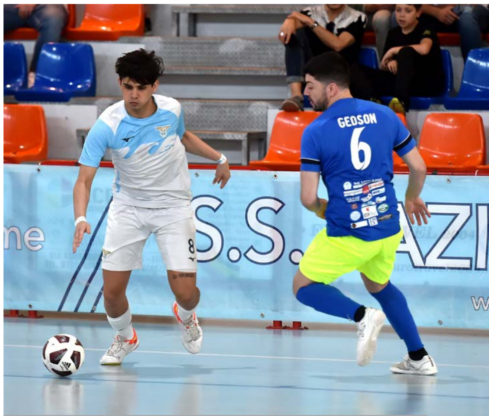
Una fase di gioco di Lazio-Lido di Ostia

Playoff Serie A2 Élite - Il primo turno ha dispensato sei pass per la prossima Serie A2 Élite. Nessun problema per il Capurso, che doma largamente la Roma anche nel match di ritorno toccando la doppia cifra. Lo Sporting Hornets impatta in casa con l'Elledi: il 6-6 non basta per avanzare, esultano i piemontesi. La Fenice ne fa 5 al PalaUnimol e costringe il Cus Molise a giocarsi tutto nel secondo turno. Tornata amarissima per le squadre del Girone B: cadono tutte, Modena compreso, fermato solo ai supplementari dal Giovinezza dopo una gara pazzesca. Impresa AV: da ultima qualificata riesce a fare fuori la miglior piazzata, i Saints Pagnano, con un perentorio 7-2 esterno. La sesta qualificata è la Leo, a cui basta pareggiare per fare fuori il Cormar. Ora il secondo turno: tre sfide e tre - le ultime - promozioni in A2 Élite. I Saints se la vedranno con la Roma, Cormar contro il Modena; chiude il quadro il confronto interno al Girone B tra Hornets e Cus Molise.