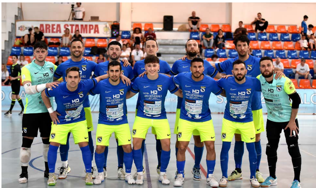
La formazione del Lido di Ostia che ha affrontato la Lazio

Attenzione totale - Il primo round, intanto, ha dato risposte più che incoraggianti, specialmente dal