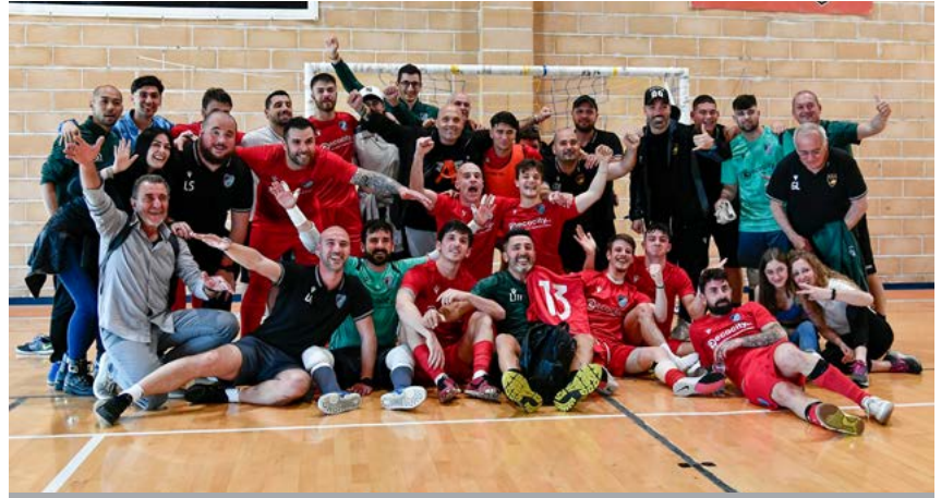
Il Genzano in trionfo dopo la vittoria dei playoff