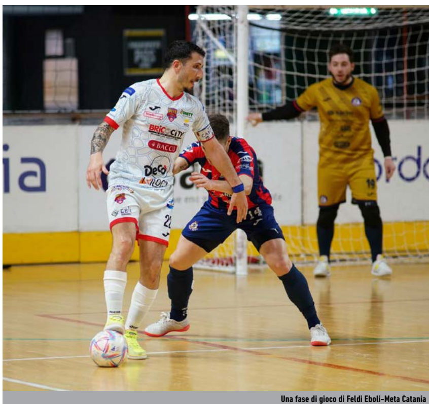
Una fase di gioco di Feldi Eboli-Meta Catania

FINALE (gara-1 10/06, gara-2 15/06, ev. gara-3 17/06) Vincente X-Vincente Y