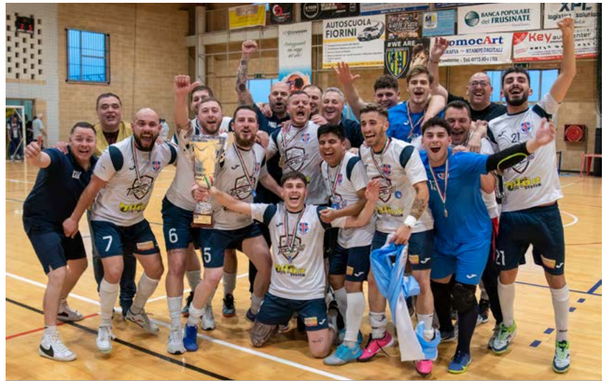
Il Palombara conquista il titolo regionale di C1